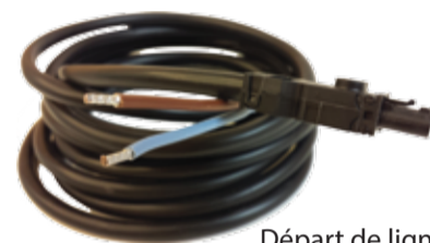
Départ de ligne