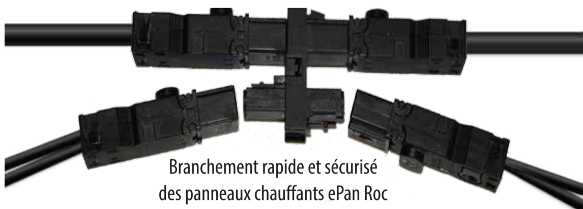
Branchement rapide et sécurisé des panneaux chauffants ePan Roc

La ligne spécialisée ePan Slim Line assure l'alimentation des films et panneaux rayonnants Ceilingo. Elle est composée d'un câble PVC de type VVF 2 x 2,5mm 2 sur lequel sont positionnés sur mesure des répartiteurs à 1, 2, 3 ou 4 prises.