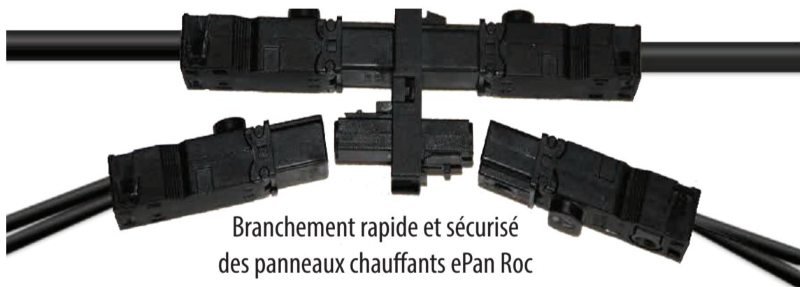
Branchement rapide et sécurisé des panneaux chauffants ePan Roc

La ligne spécialisée ePan Slim Line assure l'alimentation des panneaux rayonnants Ceilingo. Elle est composée d'un câble PVC de type VVF 2 x 2,5mm 2 sur lequel sont positionnés sur mesure des répartiteurs à 1, 2, 3 ou 4 prises.