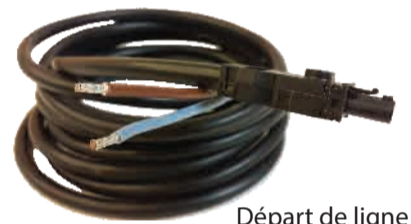
Départ de ligne